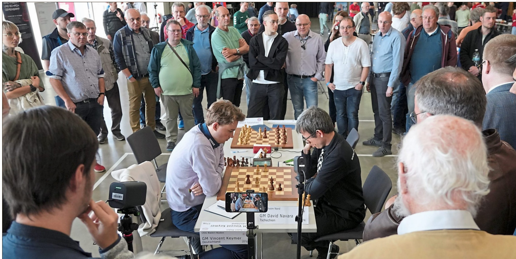
So nah kommt man Weltstars des Schachs selten: Vincent Keymer (links) in seiner Partie gegen den Tschechen David Navara.